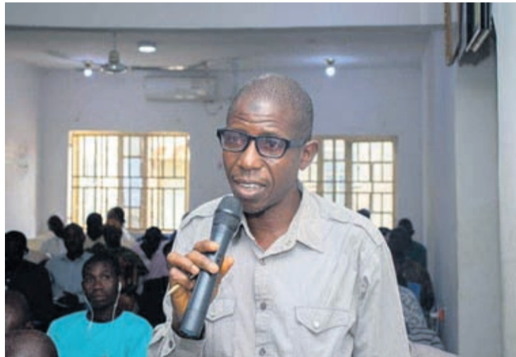
Dr. Christopher Tufton, ken a haci e anuncio durante un declaracion den Parlamento, a bisa cu e cambionan aki

lo yuda respalda e acceso na atencion medico pa e 350 mil beneficiarionan activo cu ta haci uso di e carchi NHF y e mas di 21 mil beneficiarionan di JADEP.